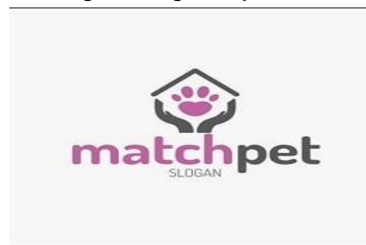
Figura 1: Logo Do Aplicativo: