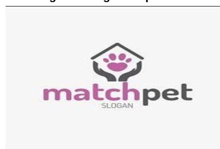
Figura 1: Logo Do Aplicativo:

PRIMEIRA PERSONA: Carla, 24 anos, sempre esteve à procura de um companheiro para suas aventuras e viagens, resolveu visitar uma ong e acabou se apegando ao pirata e o adotou. Foi sua primeira experiência como adotante e assim incentiva os outros para a mesma ação. SEGUNDA PERSONA: Emanuelle, tem 38 anos, protetora há alguns anos e já resgatou muitos animais, deu os primeiros cuidados e um abrigo até encontrar uma família adequada. TERCEIRA PERSONA: Bruna, tem 48 anos, desde muito cedo é envolvida com questões ambientais, seu grande sonho foi contribuir mais com a vida animal. Um certo dia ela abriu sua própria ong e hoje ajuda milhares de animais.