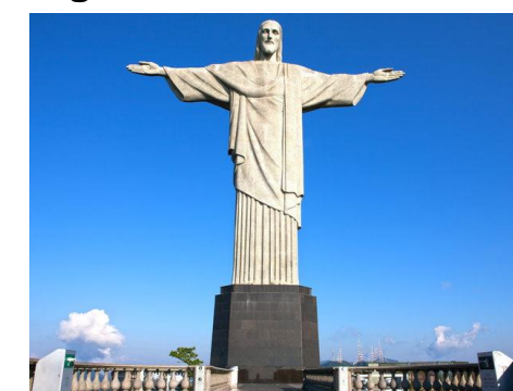
Figura 1. Cristo Redentor