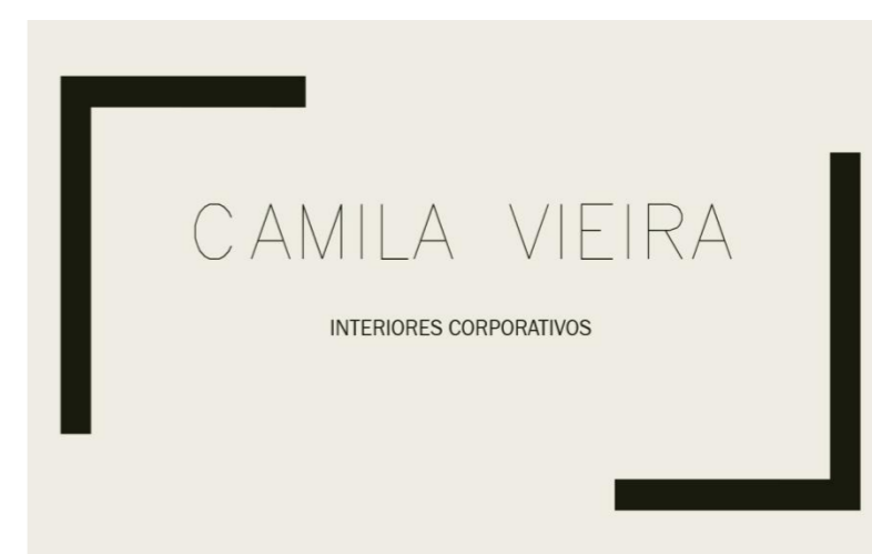
Figura 1 – Logomarca do Empreendimento

Por fim, foi elaborada a Matriz F.O.F.A (Quadro 1), onde avaliou-se os ambientes internos e externos e suas Forças, Fraquezas, Oportunidades e Ameaças.