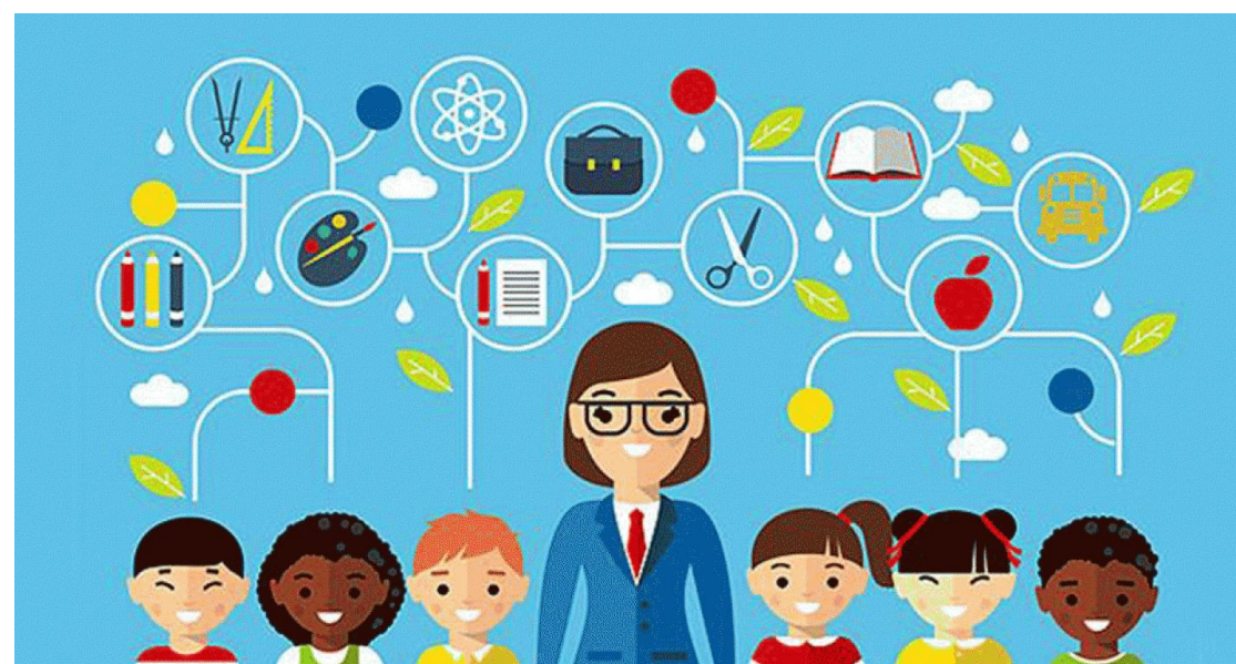
Figura 1. Proposta de logo para star up Intraschool

Com essa ideia pretende-se fazer com que os alunos entendam mais sobre o mercado de trabalho para que assim, curse universidades que se identifiquem.