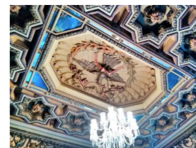
Figura 3 – Teto

Boa parte do mobiliário do século XIX foi confeccionada com a madeira nativa conhecida como jacarandá em estilo torneado. (BRANDÃO, 2010). As cadeiras do salão nobre são forradas em veludo vermelho.