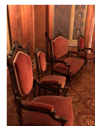
Figura 2 – Mobiliário

O piso do salão nobre foi confeccionado utilizando diferentes madeiras nativas brasileiras como canelãs, imbuia e cedros.