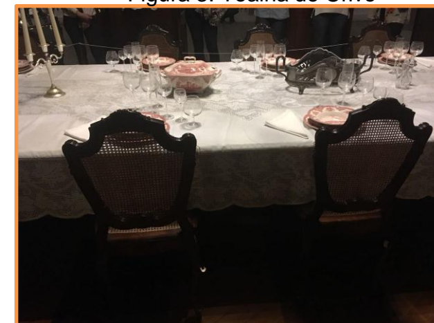
Figura 3. Toalha de Crivo

É um tipo de renda de agulha, onde seguiu os desenhos estabelecidos para sua composição. Tem aproximadamente 5m de comprimento, foi confeccionada especialmente para compor a mesa de jantar do museu cruz e Souza.