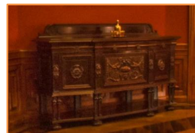
Figura 2. Balcão de Buffet