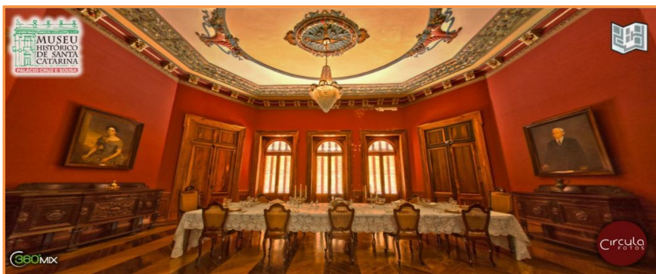
Figura 1. Sala de jantar do Palácio Cruz e Sousa