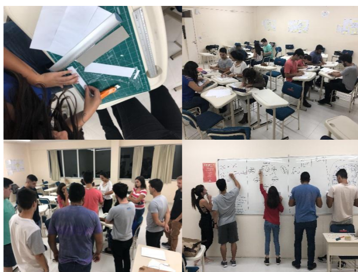
Figura 1 – Utilização em aula das técnicas de Design Thinking

Diversas técnicas de Gestão de Pessoas e de Design Thinking foram utilizadas durante o semestre para o desenvolvimento do projeto (Figura 1). O projeto está sendo desenvolvido com base nas etapas de Imersão, Análise/Síntese, Ideação e Prototipação do Design Thinking (VIANNA et al, 2012). As ferramentas utilizadas foram pesquisa desk, mapa de empatia, personas, jornada do usuário, brainstorming e interview. Foram utilizadas técnicas de Gestão de Pessoas para Desenho dos Cargos, novo processo de Recrutamento, Seleção e Socialização Organizacional, novo plano salarial para os colaboradores e estabelecimento de um sistema de Avaliação de Desempenho para o setor.