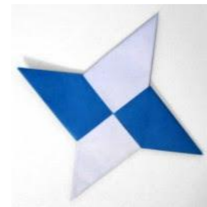
Figura 2 – Modelo de estrela fabricada

O ponto de equilíbrio foi de R$ 146,75, longe da meta de R$ 1,99. Na segunda simulação, com a utilização das técnicas de Design Thinking , a estrutura da fábrica foi totalmente remodelada para um sistema mais orgânico, conforme Figura 3, resultando em maior número de produção e vendas de estrelinhas, porém a meta ainda não foi alcançada. Entrementes, foi realizado um novo processo de Recrutamento, Seleção e Socialização Organizacional, sendo selecionado um novo Gerente de Produção e Disponibilização para a Fábrica, e está sendo elaborado um novo plano salarial para os colaboradores e um novo processo de Avaliação de Desempenho. A última simulação ocorrerá no final do semestre, quando os alunos utilizarão todas as técnicas e abordagens de Design Thinking e Gestão de Pessoas estudadas na fase para tentar alcançar a meta proposta.