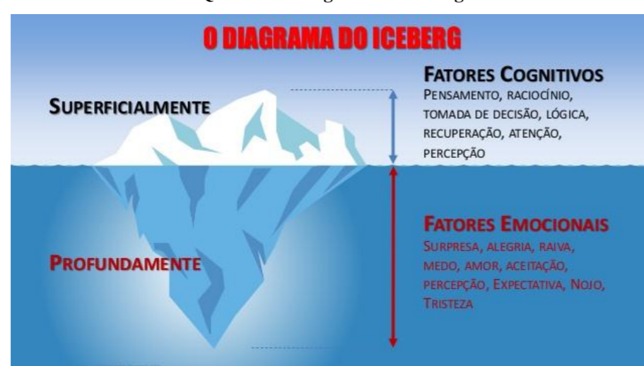
Quadro 1 – Diagrama do iceberg