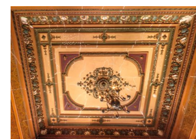
Figura 3 – Teto decorado com motivos musicais

Teto decorado com massa de estucque e ornamentado com motivos artísticos musicais. Chama-se estucque a massa de revestimento feita com pó de mármore, areia fina, cal, greda e gesso, além de água e, às vezes, cola (MOUTINHO, 2011).