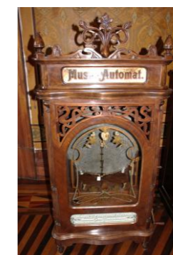
Figura 2 – Tocador de Música

Caixa de música alemã em madeira com portas de vidro em estilo Art Nouveau. Doada ao governador Jorge Lacerda (1956-1958). A caixa de música é uma "Kalliope" fabricada em Leipzig, Alemanha, no início do séc. XX. Servia originalmente como uma espécie de juke box movida com a introdução de moedas "pffening" ou centavos do Império Alemão (MHSC, [s.d.]).