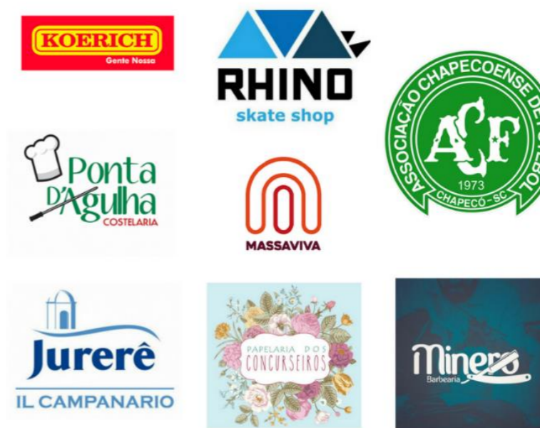
Figura 1 – Lista de patrocinadores