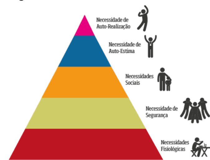
Imagem 1 – Pirâmide das Necessidades