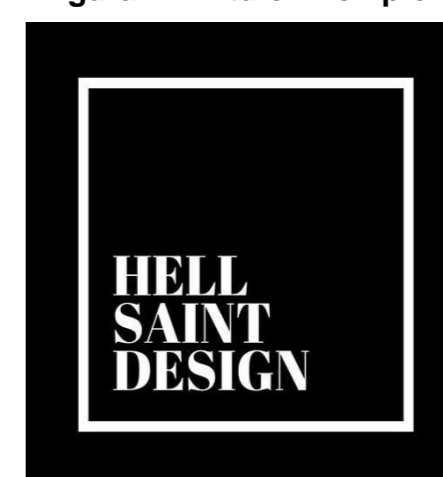
Figura 1 – Título Exemplo