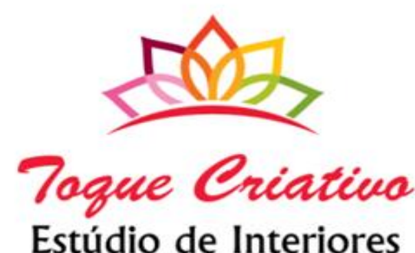
Figura 1 – Logomarca da empresa

O plano de negócios foi desenvolvido a partir da metodologia proposta pelo SEBRAE/SC, tendo sido definido como empreendimento a empresa Toque Criativo, com a seguinte missão: "Buscamos de forma incessante, nas áreas residenciais e comerciais a satisfação de cada um de nossos clientes, criando de forma original e com senso estético nossos projetos de design de interiores, empregando as mais modernas tecnologias e com profissionais motivados, comprometidos e que possuam reconhecida capacidade técnica. Temos foco na entrega respeitando as necessidades dos nossos clientes, valorizando seus desejos, expectativas e sonhos pessoais". A Figura 1 apresenta o logotipo do empreendimento. A empresa será localizada em Florianópolis - SC, e terá como público alvo pessoas jurídicas de diversos ramos, classe "A" e "B", pessoas que procuram beleza, conforto e sofisticação. Os serviços prestados serão: desenvolvimento de projetos para áreas residenciais e comerciais especificando mobiliários, materiais, cores, objetos decorativos e acessórios, entre outros itens necessários para a devida decoração do ambiente. Tipos de estratégias promocionais: cartão de visita, panfletos, redes sociais e participação em feiras e eventos. A estrutura de comercialização será em loja física, contando com uma equipe bem estruturada. A avaliação estratégica do empreendimento foi realizada a partir da Matriz FOFA (Forças, Fraquezas, Ameaças e Oportunidades), conforme ilustrado na Figura 2.