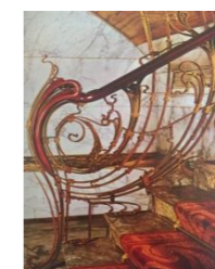
Figura 02 - Victor Horta: Balaústre da escada da Casa Solvay (1894-9) em Bruxelas.

Fonte: Livro Arte Moderna: Giulio Carlo Argan 1992, p. 201.