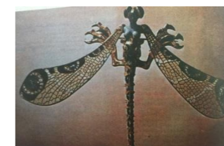
Figura 03 - "A Mulher Libélula" de René Lalique. Museu Gulbernian, Lisboa.