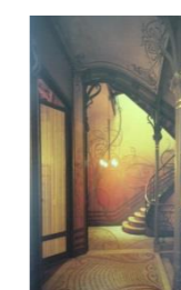
Figura 04 - "Victor Horta: Interior da Maison Tassel em Bruxelas, 1893".