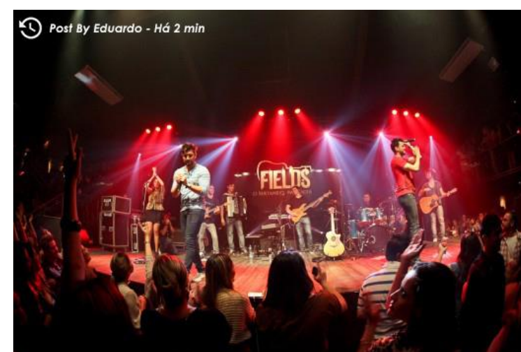
Figura 1: Publicação em tempo real