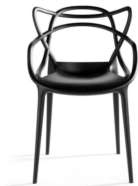
Figura 1 – Cadeira Masters

A cadeira Masters possui este nome por ser uma homenagem a três cadeiras-símbolo da história do Design, revisitadas e reinterpretadas pelo gênio criativo Philippe Starck. Foi lançada em 2009 pela marca italiana Kartell. É uma peça de mobiliário contemporânea, de design inovador.