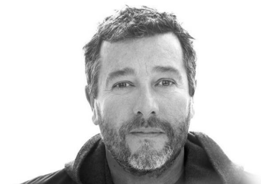
Figura 3 – Philippe Starck

Tem como suporte quatro pés estreitos e um acabamento especial que lhe proporciona uma aparência aveludada. O verdadeiro traço distintivo da cadeira é, naturalmente, seu espaldar, caracterizado pelos espaços cheios e vazios, criados pelo cruzamento sinuoso dos três diferentes elementos estruturais. Disponível em diversas cores, a Masters é leve, prática, empilhável e pode ser utilizada em ambientes externos. A cadeira Masters foi homenageada com o prestigioso “Good Design Award 2010”, concedido pelo Chicago Athenaeum – Museum of Architecture and Design .